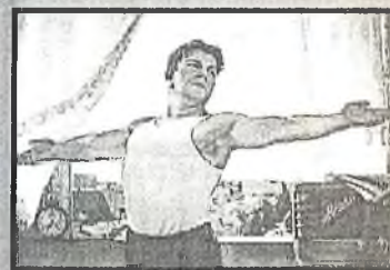
Ведите здоровый образ жизни