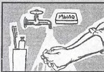
Регулярно мойте руки