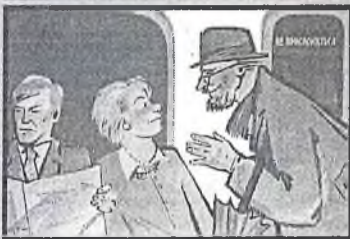
Ограничьте пребывание в местах скопления людей