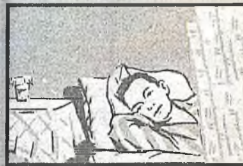
Избегайте контактов с заболевшими