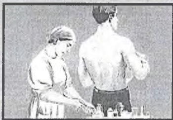
Сделайте прививку от гриппа